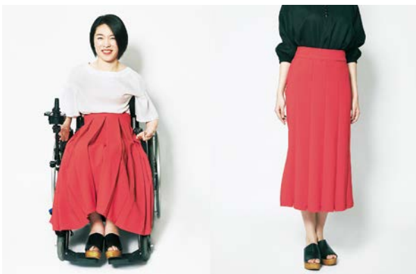
フレアにもタイトにもなるZIPスカート

*2 いまだ解決されていない誰かひとりの課題を起点に、プロダクト・サービスを開発するプロジェクト。041は「ALL FOR ONE」を意味します。 - 第一弾アイテムの受注期間は終了しています。